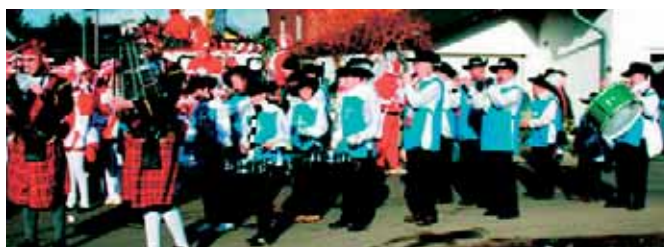
Ein Jubiläum in Rot und Weiß

Wir, die KG Rot-Weiß Enzen, möchten uns auf diesem Weg bei der gesamten Dorfbevölkerung, allen Dorfvereinen, den befreundeten Karnevalsvereinen, allen Trainer-, Betreuer/innen und nicht zuletzt bei den Eltern der aktiven Kinder recht herzlich bedanken.