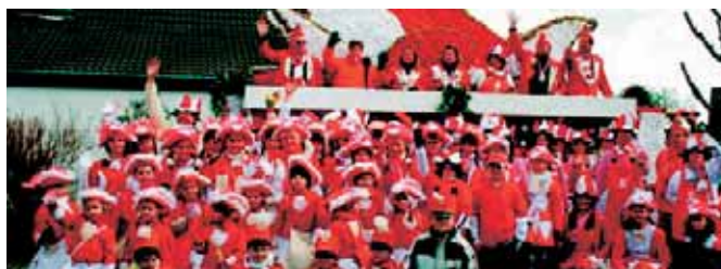
Unsere Garden im Karnevalsumzug

Unsere Kindertanz-, Prinzen-, Jugendtanz-, Juniorentanz- und Damengarde sowie das Synchronanzpaar und die Showtanzgruppe „Surprise“, absolvierten zahlreiche Auftritte weit über die Grenzen von Enzen hinaus.