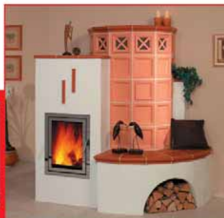
Kachelofen 5/59.1 N

DWT GmbH · Neffeltalstraße 14 · 52388 Nörvenich-Hochkirchen · Telefon 0 24 26 / 17 05