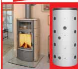
Kaminofen Hark 17 WW

Große Auswahl an HARK-KAMINEN mit Warmwasser zum Anschluss an die Zentralheizung