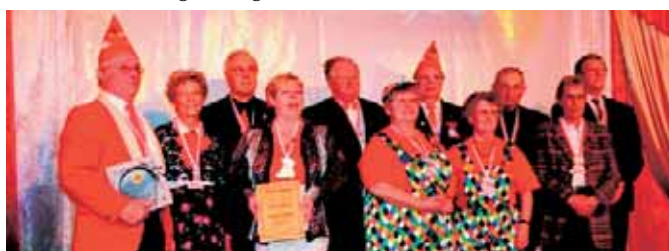
Ehrenmitglieder, Ehrenpräsident und verdiente Mitglieder auf dem Festkommers

Insgesamt wurden im beheizten Festzelt am Sportplatz fünf erfolgreiche Veranstaltungen abgehalten. Eine „Große Sitzung“, ein Festkommers, eine Kindersitzung mit vorherigem musikalischen Frühschoppen und einer Mundartmesse, buntes Karnevalstreiben mit einem abwechslungsreichen Programm an Weiberfastnacht und der Zugausklang.