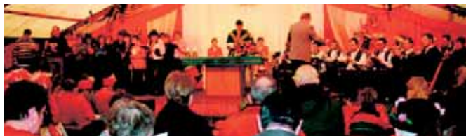
Mundartmesse mit anschl. Frühschoppen im Festzelt

Der Umzug durch den Ort am Karnevalssamstag war in diesem Jahr so groß wie nie zuvor. Die Bilder zeigen wie man in Enzen bei hervorragender Stimmung ausgelassen feiern kann.