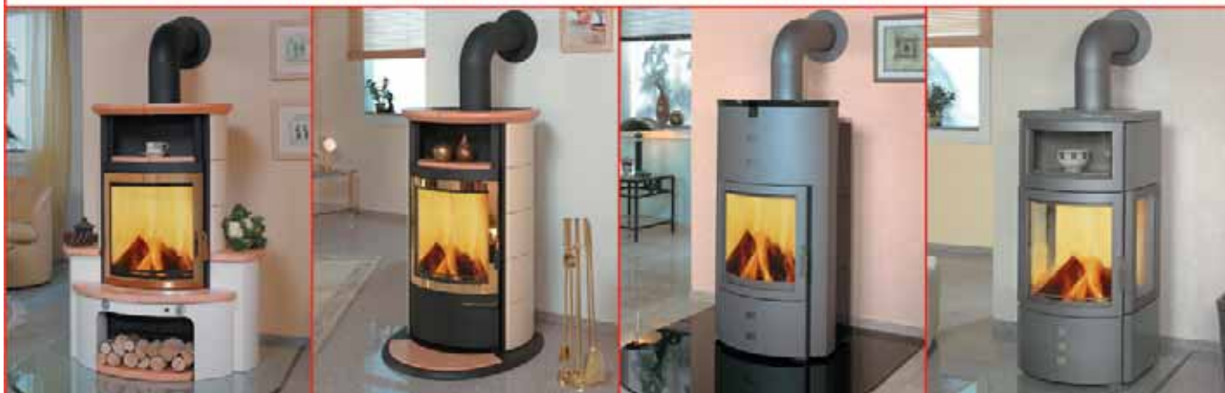
Kaminofen HARK 34 K

Kachelkamine ++ Kachelöfen ++ Natursteinkamine ++ Marmorkamine ++ Stiffassaden ++ Kaminöfen ++ Edelstahlschornsteine