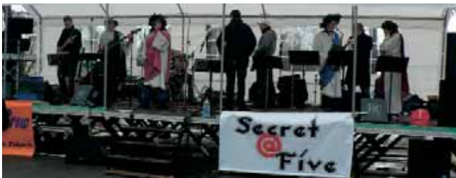
Beide Bands heizten die Besucher mit Rock und Swing richtig ein.

Für großen Andrang sorgte im Laufe des Tages der "1. Albert-Bergmann-Pokal", der mit Go-Kart's der Firma "Breuer Spieleland" auf dem "Chlodwigring" ausgetragen wurde. SchülerInnen des Gymnasiums, der Realschule, der Hauptschule und der Stephanusschule Bürvenich gingen auf den von der Firma "Breuer Spieleland" abgesteckten Parcours.