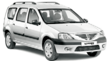
Abb. zeigt Dacia Logan MCV Lauréate.

Der Dacia Logan MCV. Jetzt in unserem Autohaus.